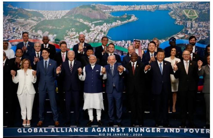
Luis Inacio Lula da Silva, center, stand with world leaders for a family photograph during the G-20 Leaders' Summit in Rio de Janeiro on Nov. 19.

ลูอิซ อินาซิโอ ลูลา ดา ซิลวา ผู้นำของบราซิล ถูก คาดหวังว่าจะยื่นหยัดสถานะของบราซิลในฐานะผู้นำ ประเทศกำลังพัฒนา แต่ความวุ่นวายในการประชุมสุด ยอดกลุ่มประเทศ G-20 ซึ่งเขาเป็นเจ้าภาพในริโอ เดอ จาเนโร กลับแสดงถึงความไร้ความสามารถของเขาในการ เชื่อมช่องว่างระหว่างมหาอำนาจระดับโลก ผู้นำหลายคน เรียกว่าเป็นการประชุมที่ไร้ระเบียบมากที่สุดในรอบหลายปี