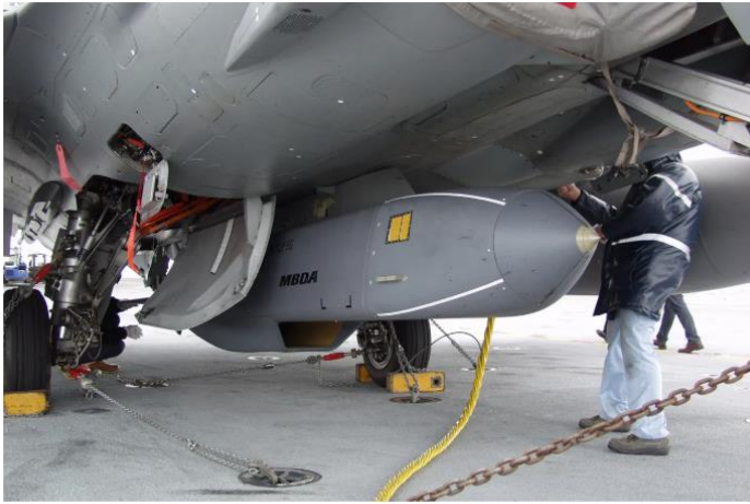
A Storm Shadow cruise missile.

ความปั่นป่วนในการประชุมไล่มาตั้งแต่ ลูลายกเลิกการ แถลงข่าวหลังการประชุมอย่างกะทันหันในช่วงบ่ายวัน อังคารก่อนหน้ากำหนดเพียงสองชั่วโมง โดยให้เหตุผล อย่างเป็นทางการว่าการประชุมทวิภาคีของลูลาใช้ เวลานานเกินไป และเขาจำเป็นต้องเดินทางกลับเมืองหลวง เพื่อต้อนรับ สี จิ้นผิง ของจีน ขณะที่ก่อนหน้านี้กรรยา ของลูลาดำหาเศรษฐี อัลลอน มัสก์ ก่อนที่การประชุมสุด ยอดจะเริ่มต้นด้วยซ้ำ นอกจากนี้ในระหว่างที่ถ่ายภาพ หมู่ก่อนเข้าประชุม บราซิลเลือกจะถ่ายรูปลูกหมู่โดยไม่รอให้ ประธานาธิบดี โจ ไบเดน มาถึงที่งาน มากไปกว่านั้นลูลาได้ ยุติการเจรจาอย่างกะทันหันในแถลงการณ์ของกลุ่ม G-20 เมื่อคืนวันจันทร์ ขณะที่บรรดาผู้นำยังคงหารีตถึงการ ปรับเปลี่ยนภาษาเกี่ยวกับการประนามสงครามของรัสเซีย ในยูเครนและความขัดแย้งในวันออกกลาง