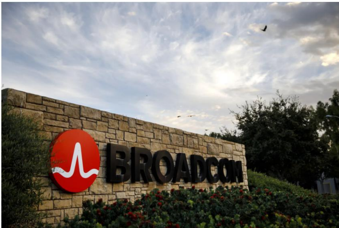
Data center providers rely on Broadcom's custom-chip design and networking semiconductors to build their AI systems.