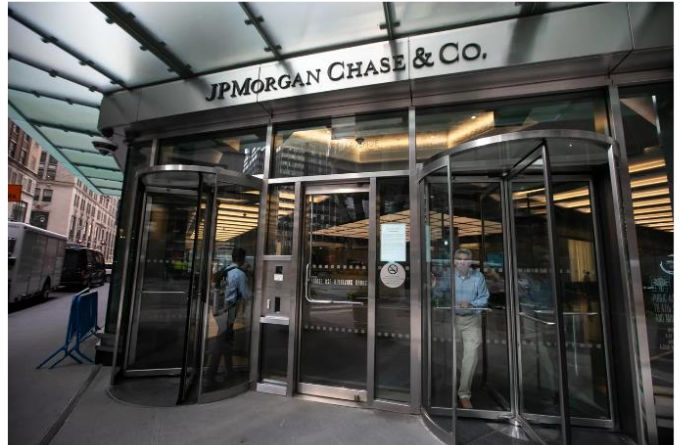
The new framework followed a fierce lobbying campaign by the industry.