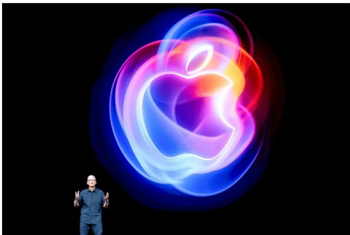
Apple CEO Tim Cook during the unveiling of the company's new iPhone, AirPods and watches.