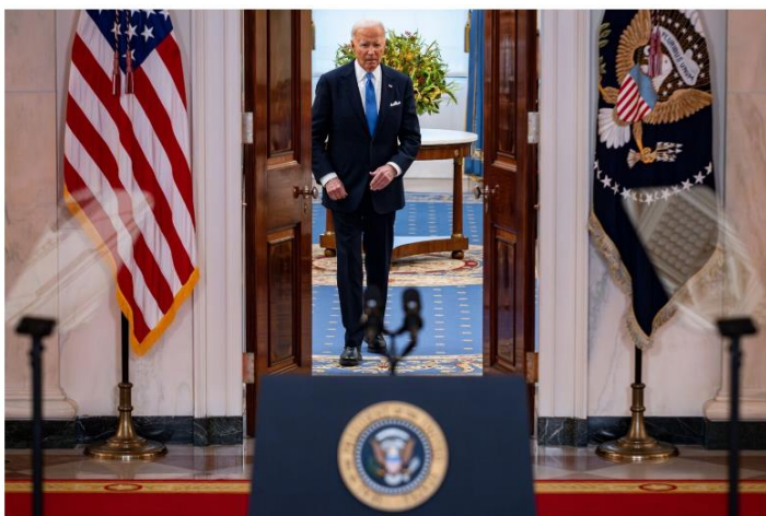
Joe Biden.

▶ สมาชิกสภานิติบัญญัติจากพรรคเดโมแครตหลายสิบคน กำลังพิจารณาลงนามในจดหมายเรียกร้องให้ โจ ไบเดน ถอนตัวจากการเป็นตัวแทนพรรคในการเลือกตั้ง แล่งข่าวจากเจ้าหน้าที่ระดับสูงของพรรคกล่าว สืบเนื่องจากความตื่นตระหนกว่าประธานาธิบดีสหรัฐฯ กำลังทำให้พันธมิตรหมดความเชื่อมั่นและสูญเสียการควบคุมรัฐสภา โดย สส. ต่างกังวลว่าพรรคอาจถูกกวาดเก้าอี้ในสภาโดย พรรครีพับลิกัน และจะเสียตำแหน่งประธานาธิบดีให้นาย โด널ด์ ทรัมป์ อย่างที่ไม่สามารถคำนวณอำนาจได้ ในขณะเดียวกันโฆษกทำเนียบขาวแถลงปฏิเสธรายงานของ นสพ. นิวยอร์ก ไทมส์ ที่ระบุว่าประธานาธิบดีกำลังพิจารณาถอนตัวจากการแข่งขัน