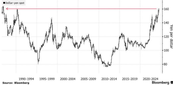
Yen Slides to Weakest Since 1986 Dollar rally keeps FX traders on intervention alert