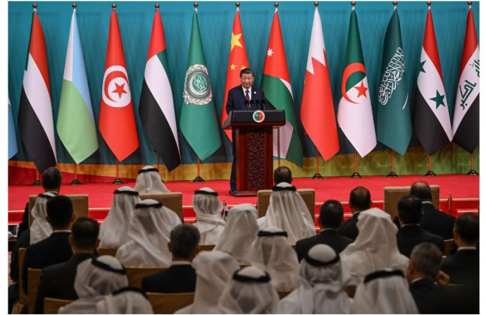
Xi Jinping during the opening ceremony of the 10th Ministerial Meeting of China-Arab States Cooperation Forum in Beijing on May 30.