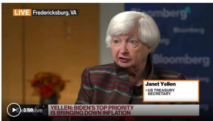
Yellen Says China Isn't 'Playing by the Rules' on Trade

▶ Janet Yellen รัฐมนตรีกระทรวงการคลังสหรัฐฯ กล่าวว่าเธอหวังว่าจีนจะไม่ตอบโต้ครั้งใหญ่ต่อนโยบายเข้มงวดทางการค้าใดๆ ก็ตามที่สหรัฐฯจะดำเนินการเพื่อปกป้องการลงทุนในอุตสาหกรรมใหม่ที่สำคัญ และเน้นย้ำว่าสหรัฐฯ จะไม่ยอมให้อุตสาหกรรมเกิดใหม่เหล่านี้ถูกกวาดล้างจากการแข่งขันที่ไม่เป็นธรรมของจีน อย่างไรก็ตาม เธอปฏิเสธที่จะยืนยันว่าฝ่ายบริหารของรัฐบาลสหรัฐฯ กำลังวางแผนเพิ่มอัตราภาษีสินค้านำเข้าจีน อย่างรถยนต์ไฟฟ้า แบตเตอรี่ และโซลาร์เซลล์ ที่กำลังเป็นข่าวในขณะนี้