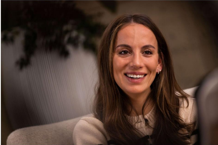
Mira Murati

Mira Murati นักวิจัยของ OpenAI และประธานเจ้าหน้าที่ฝ่ายเทคโนโลยีได้สนทนากับ ChatGPT ในการสาธิต ในระหว่างการนำเสนอ แชทบอทยังสามารถแปลคำพูดจากภาษาหนึ่งเป็นอีกภาษาหนึ่งเกือบจะในทันที และสามารถร้องเพลงส่วนหนึ่งตามคำขอ