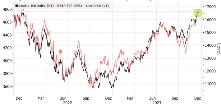
Stock Indexes at or Near All-Time Highs Nasdaq 100 hits new record, S&P 500 close to previous peak