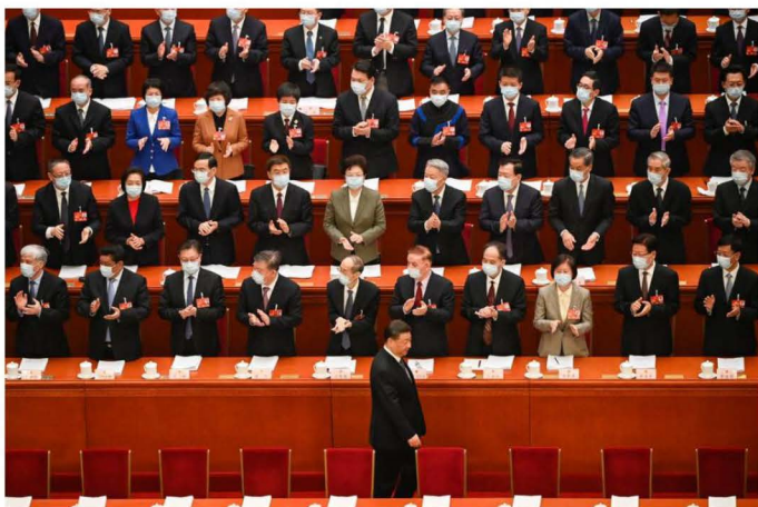
Xi Jinping arrives for the second plenary session of the National People's Congress on March 7.

▶ ประธานาธิบดี Xi Jinping อนุมัติการยกเครื่องระบบราชการของจีนครั้งใหญ่ที่สุดในรอบหลายทศวรรษ ซึ่งเป็นส่วนหนึ่งของการผลักดันให้เศรษฐกิจสามารถพึ่งพาตนเองได้มากขึ้น ท่ามกลางความพยายามของสหรัฐฯ ในการป้องกันไม่ให้จีนขโมยเทคโนโลยีขั้นสูง โดยแผนดังกล่าวประกอบไปด้วยการเสริมสร้างการกำกับดูแลระบบการเงินมูลค่า 60 ล้านล้านดอลลาร์ สร้างหน่วยงานใหม่เพื่อจัดการด้านความปลอดภัยของข้อมูล และปรับโครงสร้างกระทรวงวิทยาศาสตร์และเทคโนโลยีให้ดูแลครอบคลุมการพัฒนาเทคโนโลยีใหม่ๆ ความเคลื่อนไหวดังกล่าวมีขึ้นในขณะที่รัฐมนตรีต่างประเทศคนใหม่ Qin Gang เตือนว่าสหรัฐฯ พยายามควบคุมและเอาชนะจีนซึ่งก่อให้เกิดความเสี่ยงต่ออนาคตของมนุษยชาติ