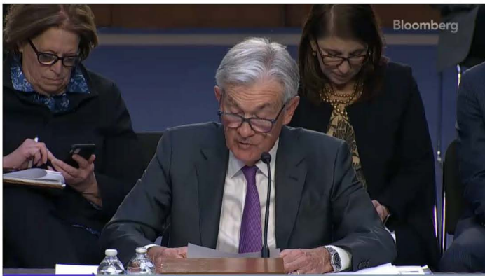
Powell: Fed Prepared to Increase Pace of Hikes If Needed

ดอกเบียเมื่อเดือนที่แล้ว จากถ้อยแถลงของนาย Powell ต่อหน้าสภาคงเกรสในวันอังคาร เสมือนเปิดประตูที่เฟด จะปรับขึ้นอัตราดอกเบี้ย 0.5% ในการประชุมครั้งต่อไป หากรายงานเกี่ยวกับแรงงานและเงินเฟ้อที่จะประกาศแสดง ให้ว่าการปรับขึ้นอัตราดอกเบี้ยไม่ได้ทำให้เศรษฐกิจเย็นลง “ข้อมูลเศรษฐกิจล่าสุดออกมาแข็งแกร่งเกินคาด ซึ่งบ่งชี้ ว่าระดับสูงสุดของอัตราดอกเบี้ยน่าจะสูงกว่าที่คาดการณ์ไว้ก่อนหน้านี้” Powell กล่าวกับคณะกรรมการธนาคารในวุฒิสภา “หากผลรวมของข้อมูลบ่งชี้ว่าการ รัตเข้มงวดเร็วขึ้นนั้นเป็นสิ่งที่เหมาะสม เราก็พร้อมที่จะเพิ่ม อัตราการขึ้นอัตราดอกเบี้ยอีกครั้ง”